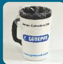
SACOS DE COLETA