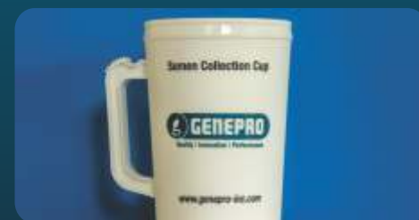
COPO DE COLETA