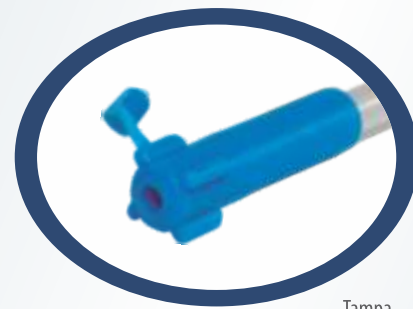
Tampa Anti Refluxo